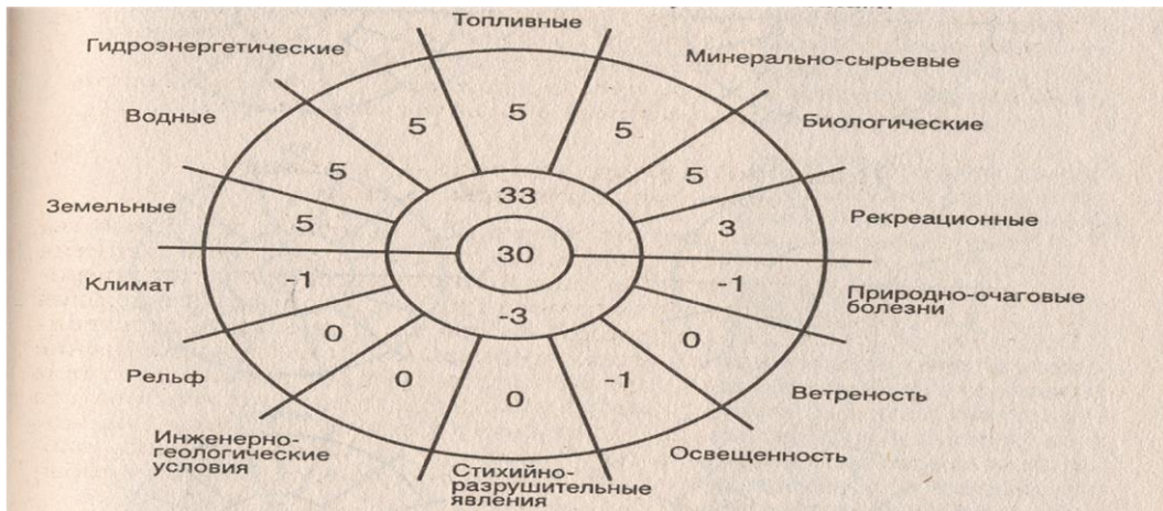
Рис. 16. Оценка сочетания природных условий и природных ресурсов России